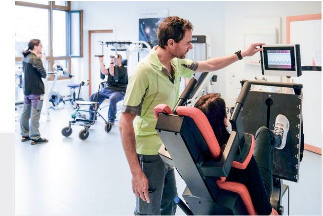
Interdisziplinäre Betreuung und kurze Wege im Rehaszentrum Chur am Standort Kreuzspital des Kantonsspital Graubünden (KSGR).